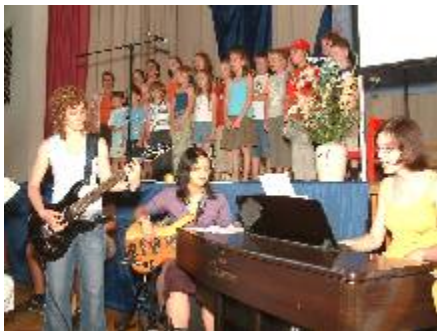
Liedvortrag der Kindergottesdienstkinder mit deren Musikteam.

Das diesjährige Gemeindefest hatte das Motto »Wir gehören zusammen - Jeder ist wichtig«. Dieses Thema stand im Mittelpunkt des Gottesdienstes in der Turnhalle, mit dem dieser Festtag eröffnet wurde. Der Kindergottesdienst wirkte im Gottesdienst mit: